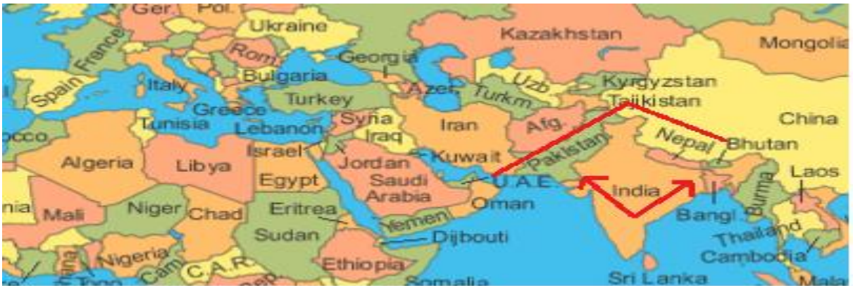
Şekil 3. ÇPEK İle Hindistan'ın Çevrenmesi

Soğuk Savaş başladığında dünyada komünist bloğun başını çeken Sovyetler Birliği ve kapitalist bloğun başını çeken ABD olmak üzere çift kutuplu bir sistem oluşmuştu. ABD ve Sovyetler Birliği, nüfuz alanlarını genişletmek amacıyla bloklar arasında tarafsız kalan ülkeleri kendi taraflarına çekmek istemekteydiler. Bu dönemde ayrıca ABD'nin Sovyetler Birliği'ni çevreleme stratejisi olduğu da bilinmektedir. Bu amaçla ABD çeşitli askeri ve teknik yardımlar ile Pakistan'ı kendi tarafına çekmeyi başarmıştır. CPEK'in jeostratejik önemi de burada ortaya çıkmaktadır. Geçmişte ABD'nin Sovyetler Birliği'ni ve Çin'i çevrelemek için ilişkiler geliştirdiği Pakistan, Çin ile CPEK projesi kapsamında başta ekonomi olmak üzere askeri ve kültürel ilişkilerini geliştirmektedir.