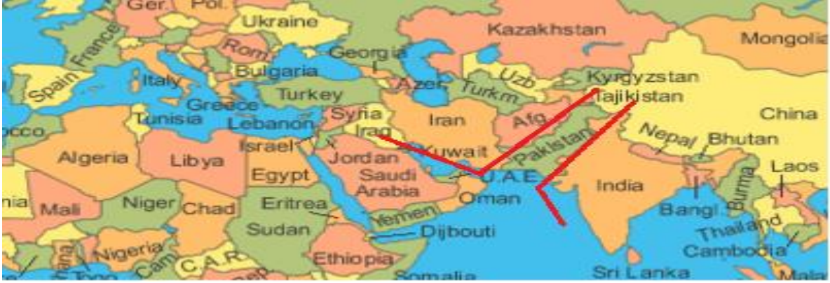
Şekil 2. Pakistan'ın Jeostratejik Önemi

Soğuk Savaş başladığında dünyada komünist bloğun başını çeken Sovyetler Birliği ve kapitalist bloğun başını çeken ABD olmak üzere çift kutuplu bir sistem oluşmuştu. ABD ve Sovyetler Birliği, nüfuz alanlarını genişletmek amacıyla bloklar arasında tarafsız kalan ülkeleri kendi taraflarına çekmek istemekteydiler. Bu dönemde ayrıca ABD'nin Sovyetler Birliği'ni çevreleme stratejisi olduğu da bilinmektedir. Bu amaçla ABD çeşitli askeri ve teknik yardımlar ile Pakistan'ı kendi tarafına çekmeyi başarmıştır. CPEK'in jeostratejik önemi de burada ortaya çıkmaktadır. Geçmişte ABD'nin Sovyetler Birliği'ni ve Çin'i çevrelemek için ilişkiler geliştirdiği Pakistan, Çin ile CPEK projesi kapsamında başta ekonomi olmak üzere askeri ve kültürel ilişkilerini geliştirmektedir.