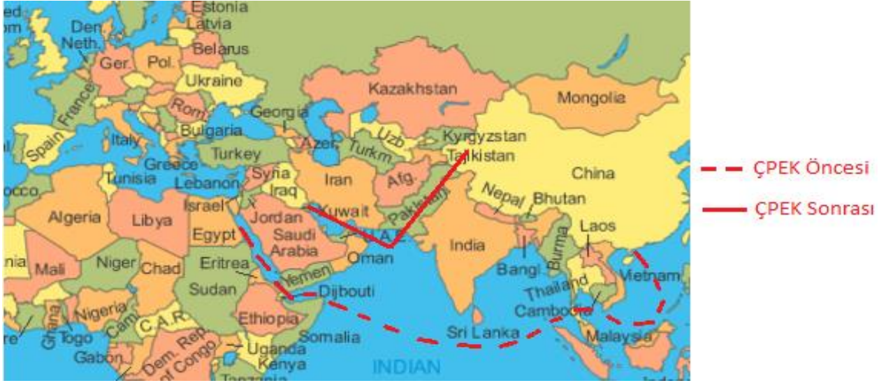
Şekil 5. ÇPEK Öncesi ve Sonrasında Çin'in Enerji Güzergahı

Çin'in Afrika'dan ithal edeceği hammaddeler, Körfezden ve Orta Asya'dan ithal edeceği petrol ve doğalgaz için de ÇPEK stratejik önemdedir. Çin için Güney Çin Denizi giderek daha sorunlu bir alan olmaya başlamıştır. Çin'in Güney Çin Denizi'nde yapay adacıklar oluşturarak sahiplik iddia etmesi Malezya, Endonezya, Vietnam, Tayvan, Filipinler, Tayland gibi Güney Çin Denizi'ne kıyısı olan ülkeleri rahatsız etmektedir.